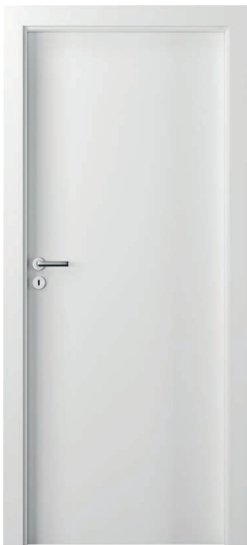
MINIMAX P, Bílá