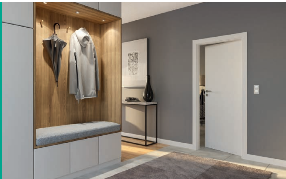
MINIMAX P, Bílá